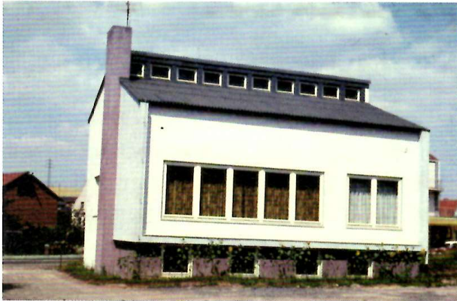
Das Thomas-Morus-Haus im Jahr 1965